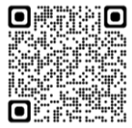
(※1) 全学共通教養教育 センターホームページ

(※4) 既習の初修外国語の登録を希望する1年次生の面談、登録資格を有しない初修外国語、及びこれまで認定・飛び級した初修外国語の登録を引き続き希望する学生の面談を実施。