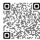
(※2) 国際課ホームページ