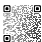
(※2) 国際課ホームページ