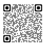
(※1) 全学共通教養教育 センターホームページ

(※4) 既習の初修外国語の登録を希望する1年次生の面談、登録資格を有しない初修外国語、及びこれまで認定・飛び級した初修外国語の登録を引き続き希望する学生の面談を実施。