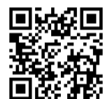
(※2) 国際課ホームページ